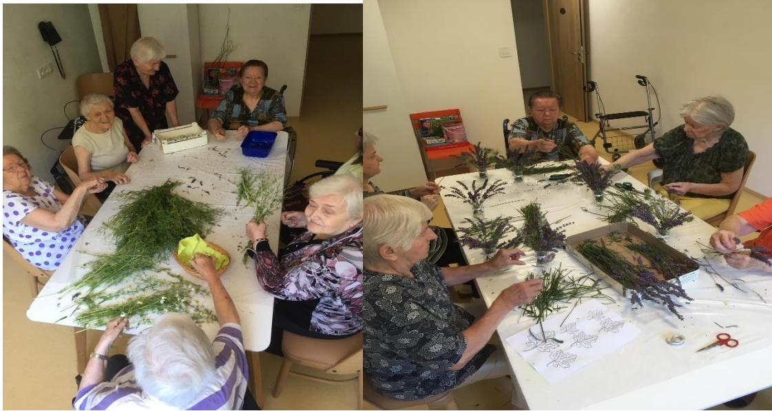
Práce s vypěstovanými a nasušenými léčivými bylinkami