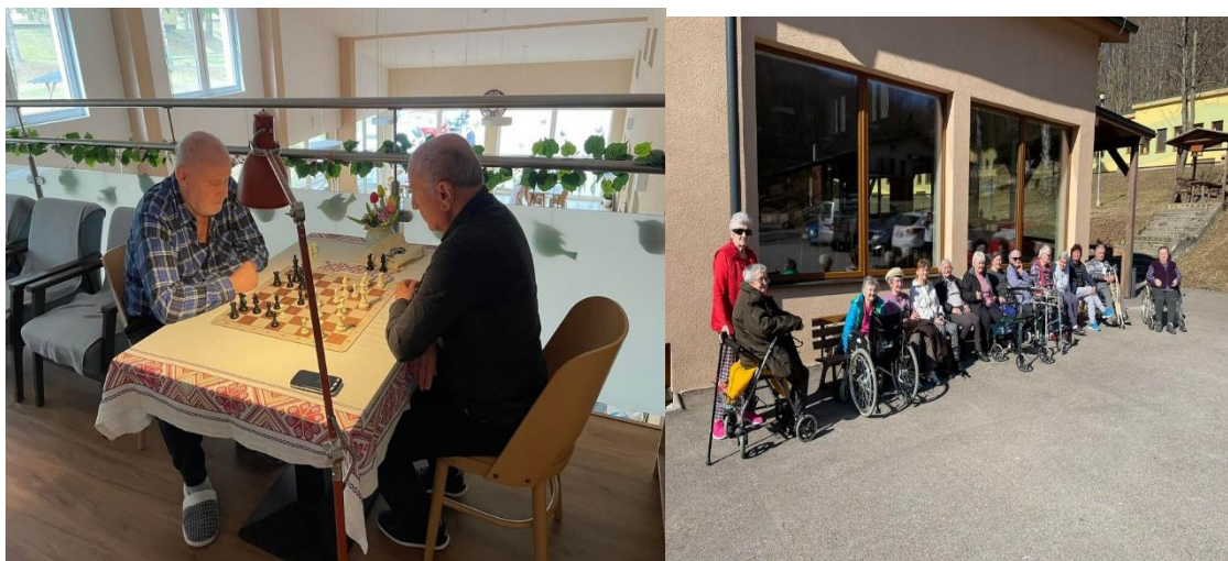
Ukážka voľnočasových aktivít