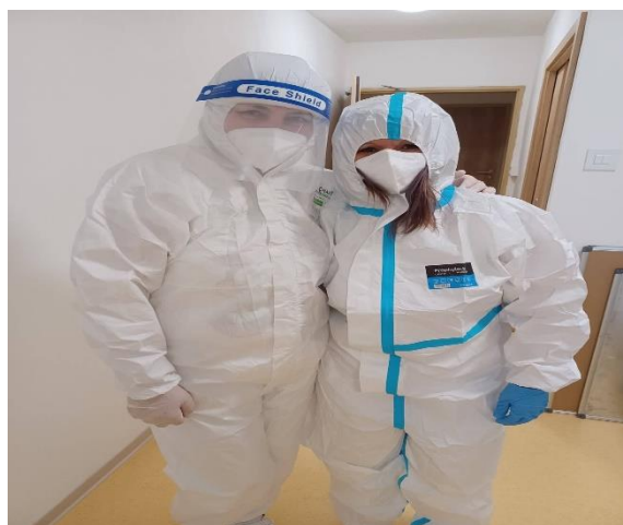
Aj takto sme počas roku 2021 pracovali.....

Ďakujem všetkým zamestnancom za ich čas, ochotu a záujem zvládnuť ťažkú covidovú situáciu a klientom za pochopenie pre nariadené opatrenia